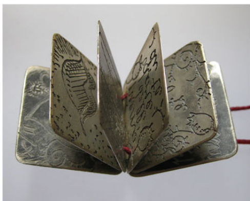
“Ex voto”, libro en plata, grabado, Elisa Pellacani