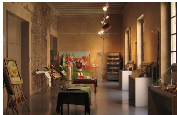
"Un llibre únic per San Jordi", exposició col·lectiva en el Centre Cívic Pati Llimona

"Imagine book", la convocatoria actual que la Asociación propone, quiere presentar el libro como espacio creativo y de investigación artística prescindiendo de las diferentes disciplinas "técnicas", así como herramienta útil y completa para la educación. Con esta idea, se han contactado también escuelas de arte y centros educativos. Hacer corresponder la inauguración de "Imagine Voc." con el día de San Jordi se ha quedado la prioridad del proyecto viviéndolo no como un día de presencia en el lugar público, pero más bien con la intención de crear un espacio físico dedicado a los artesanos, artistas y creativos de varias disciplinas que están detrás a libros que salen del normal mercado de los libros, entonces presentando el universo libro desde quien lo proyecta, lo imagina, hasta quien trabaja a su edición.